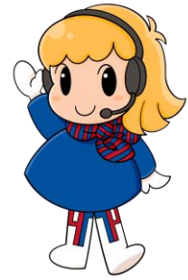
ヤマイチテクノ イメージキャラクター ”テクノちゃん”